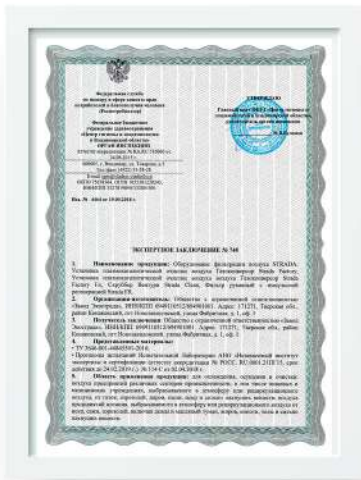
Экспертное заключение Роспотребнадзора