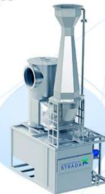
Скруббер STRADA CLEAN