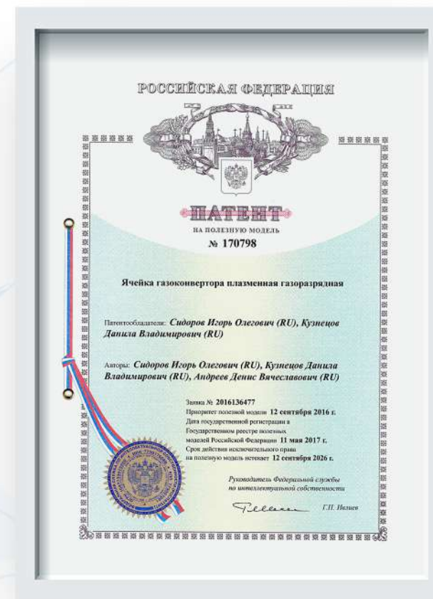
Патент ячейка плазменная