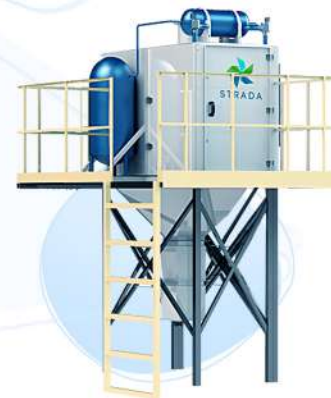
Рукавный фильтр STRADA FR