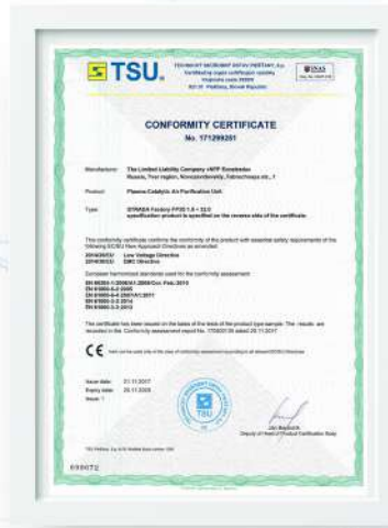
Сертификат соответствия СЕ