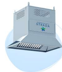
Зонт – рециркулятор STRADA