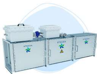
Взрывозащищенный Газоконверсор STRADA FACTORY Ex