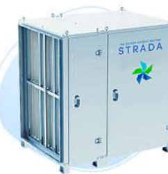
Адсорбер STRADA SORB