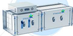
Газоконвертор STRADA STANDART