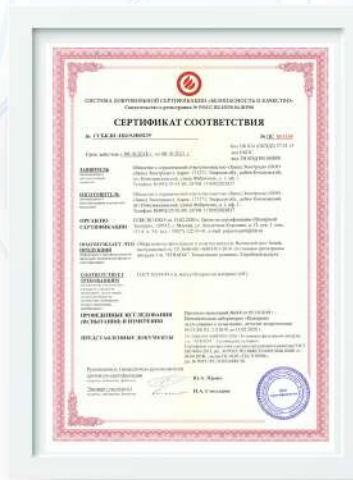
Сертификат соответствия пожарной безопасности