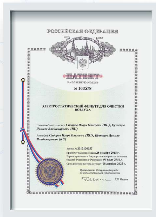
Патент электростатический фильтр