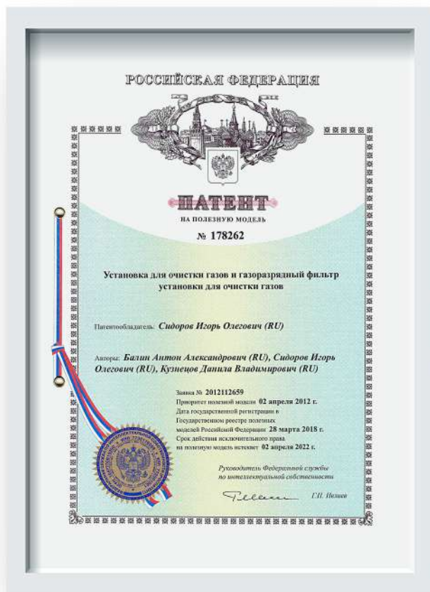
Патент газоразрядный фильтр