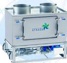
Гидрофильтр STRADA HYDRO B