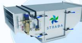
Искрогаситель STRADA HYDRO C