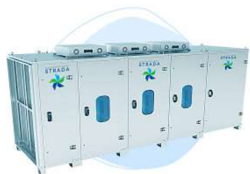
Газоконверсор STRADA FACTORY

Завод Экострада производит серийно следующее воздухоочистное оборудование: