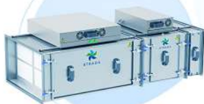
Дымофильтр электростатический STRADA FES