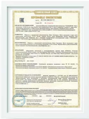
Сертификат соответствия ЕАС